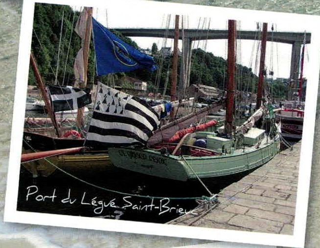
Port du Légué Saint-Brieuc