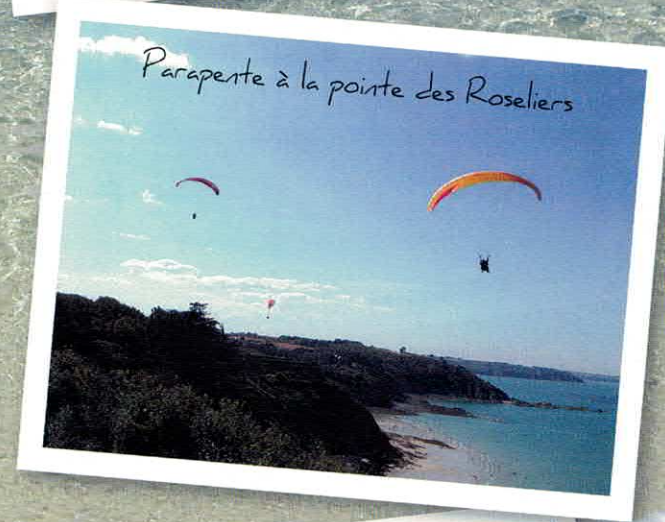
Parapente à la pointe des Roseliers