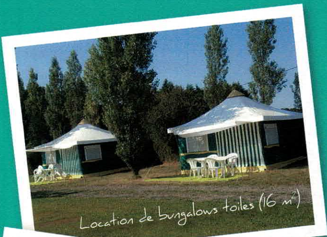
Location de bungalows toilés (16 m 2 )

Emplacements tout confort, parcelles privatives avec terrasse. Tous nos mobil-homes sont équipés d'une télévision et de chauffage