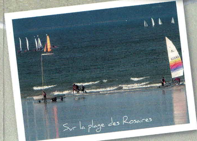
Sur la plage des Rosaires