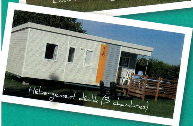
Hébergement décalé (3 chambres)