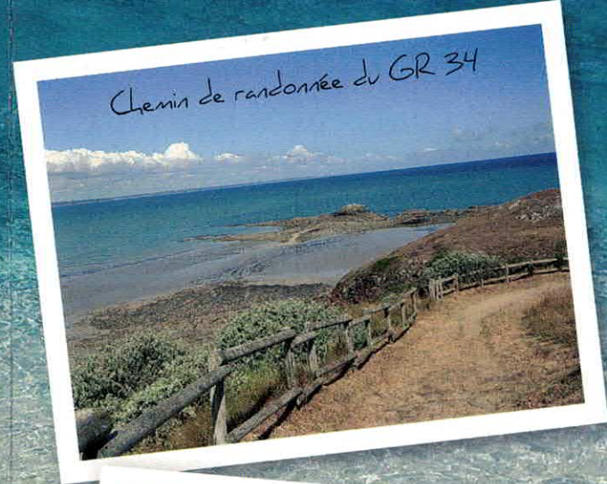
Chemin de randonnée du GR 34